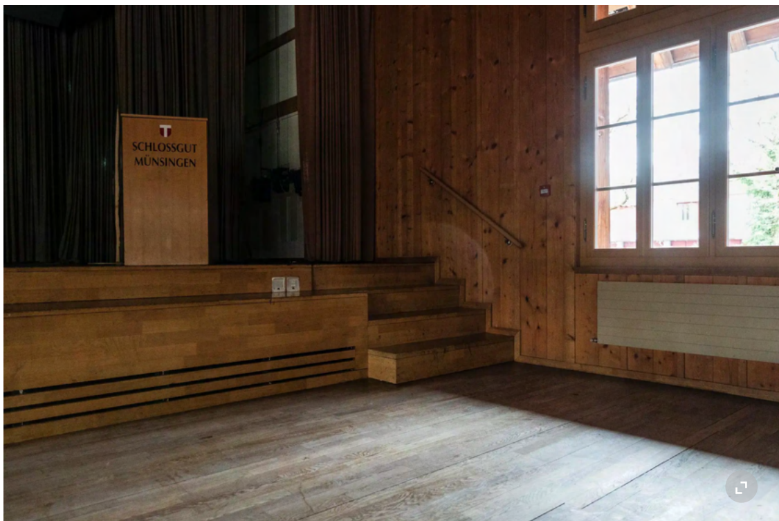
Beim Umbau des Schlossgutsaals wird ein Bühnenlift für Menschen mit Beeinträchtigung gebaut.

Damit ist der Ton gesetzt. Man sieht Baumann seine Beeinträchtigung an. Man hört sie auch. Er redet mit monotoner Stimme, am Anfang klingen die Sätze etwas unverständlich. Bis man sich daran gewöhnt hat.